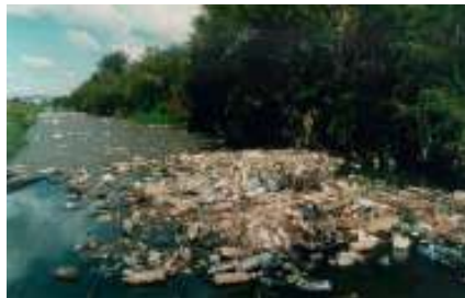
Poluição dos recursos hídricos