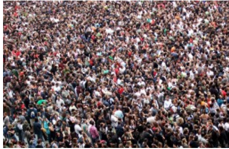
Aumento da população