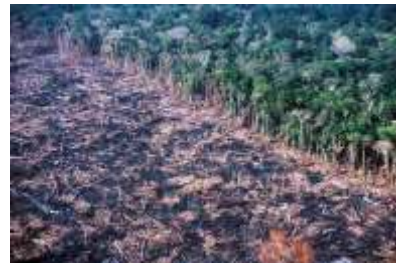
Desmatamento e queimadas